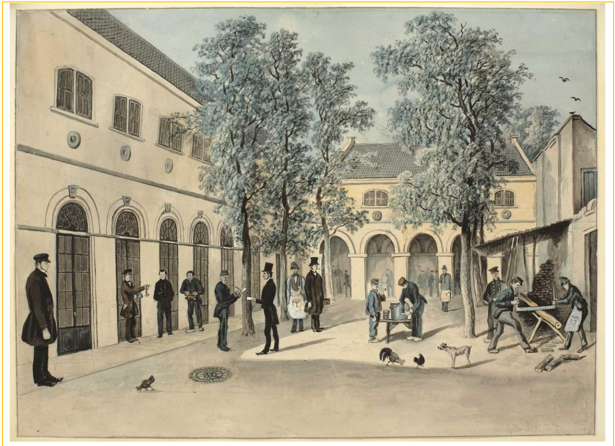
de binnenplaats van de heren in het Willem Arntszhuis rond 1855 getekend door een patiënt