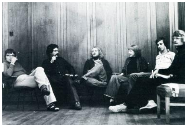
Een therapeutische gemeenschap in de jaren zeventig onderdeel van het Provinciaal Ziekenhuis Santpoort

Bij de leerstoelstichting en de Universiteit Utrecht leefde de uitdrukkelijke wens om de leerstoel te continueren na de beëindiging van het bijzondere hoogleraarschap in september 2014. Dankzij de nieuw toegezegde steun door de deelnemers van de leerstoelstichting is de financiering van de leerstoel weer voor vijf jaar gegarandeerd. Mede op basis daarvan stelde het College van bestuur van de Universiteit Utrecht in januari 2016 wederom een leerstoel in voor de geschiedenis van de psychiatrie, nu voor een gewoon hoogleraar. Met ingang van 1 maart 2016 trad Joost Vijselaar weer aan in die functie. Het bestuur van de stichting is bijzonder verheugd met zowel de steun uit de sector als met de bereidheid van de Universiteit Utrecht om een leerstoel te creëren. De stichting kan haar werk zo zeker vijf jaar voortzetten.