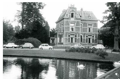
Het eerste psychiatrische dagziekenhuis in Velp rond 1962